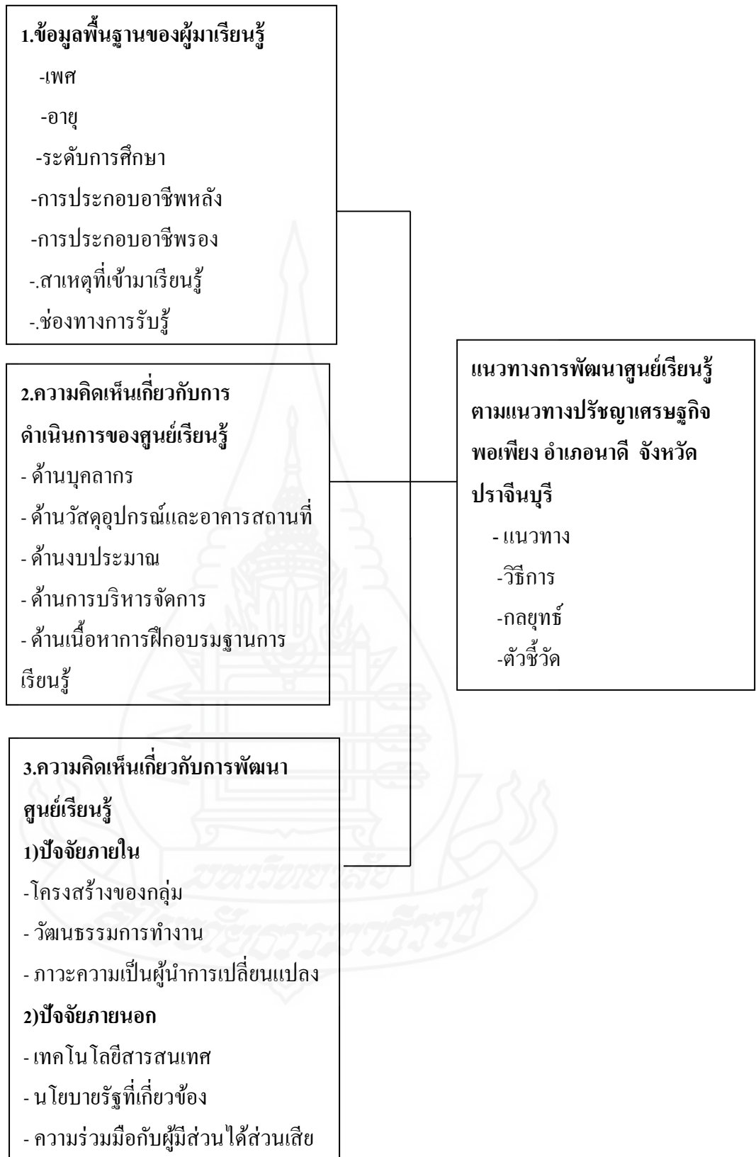
ภาพที่ 1.1 กรอบแนวคิดการวิจัย