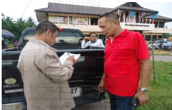
ภาพที่ 1.41 ภาพการสัมภาษณ์