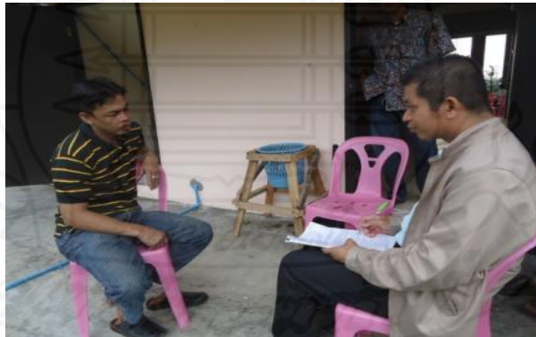
ภาพที่ 1.7 ภาพการสัมภาษณ์