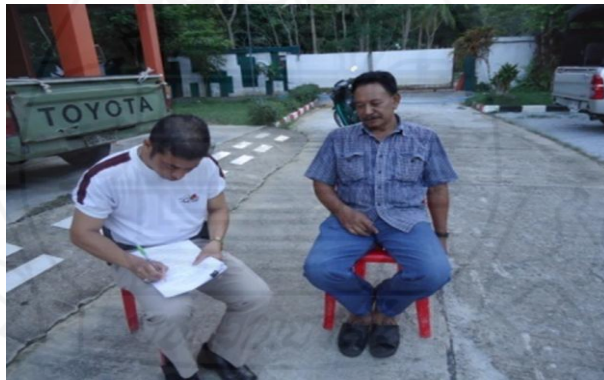
ภาพที่ 1.2 ภาพการสัมภาษณ์