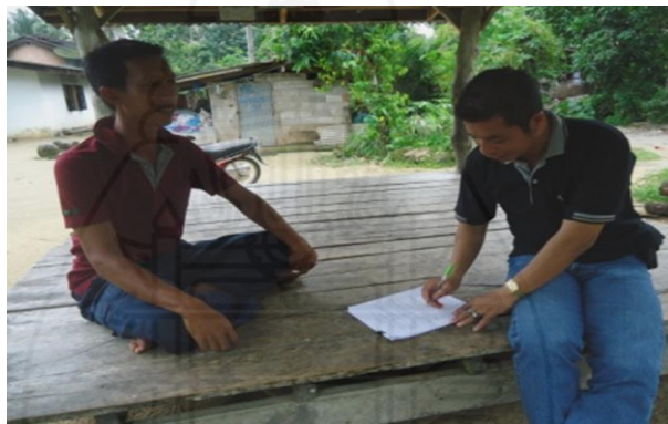
ภาพที่ 1.5 ภาพการสัมภาษณ์