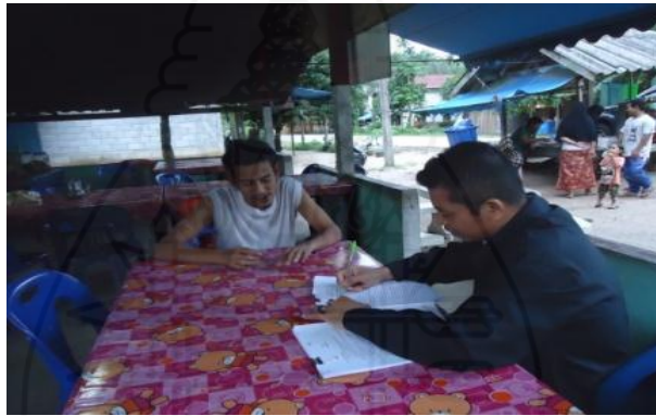
ภาพที่ 1.43 ภาพการสัมภาษณ์