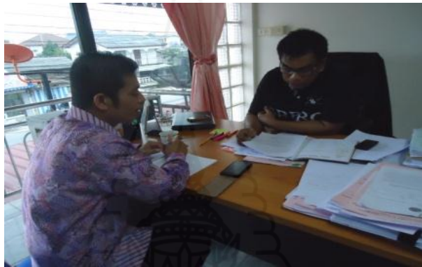
ภาพที่ 2.6 ภาพการสัมภาษณ์