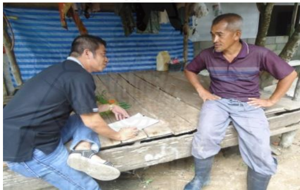
ภาพที่ 1.44 ภาพการสัมภาษณ์