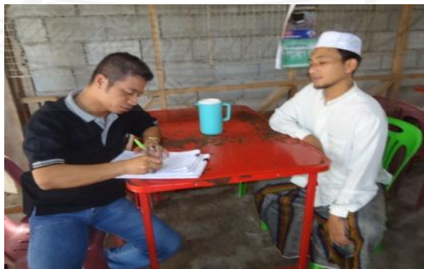
ภาพที่ 1.36 ภาพการสัมภาษณ์