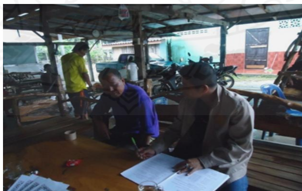
ภาพที่ 1.19 ภาพการสัมภาษณ์