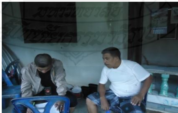
ภาพที่ 1.39 ภาพการสัมภาษณ์