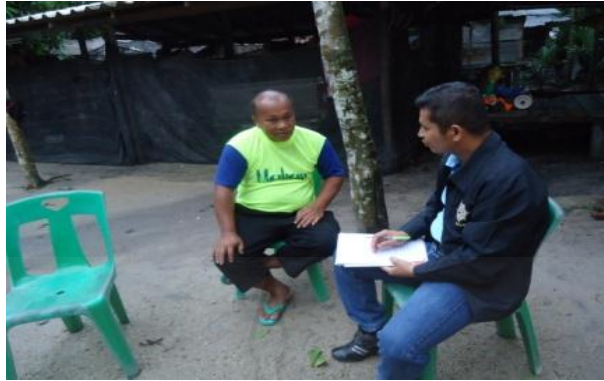
ภาพที่ 1.46 ภาพการสัมภาษณ์

2. ข้อมูลทั่วไปของผู้ให้สัมภาษณ์ที่เป็นผู้สมัครรับเลือกตั้งสมาชิกสภาผู้แทนราษฎร ในเขตเลือกตั้งที่ 4 จังหวัดนครราชสีมา และผลการสัมภาษณ์ตามประเด็นการวิจัยที่กำหนดไว้ ดังนี้