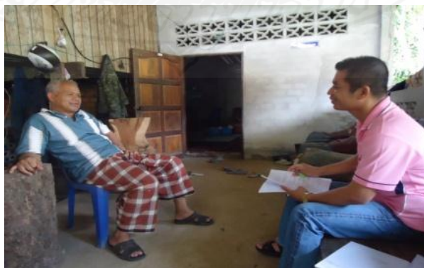
ภาพที่ 1.14 ภาพการสัมภาษณ์

จากการเลือกตั้งสมาชิกสภาผู้แทนราษฎรเป็นการ ทั่วไป เมื่อวันที่ 3 กรกฎาคม 2554 ตนเองไม่ได้ใช้ บทบาทและอำนาจหน้าที่ในการชี้แนะให้ประชาชน ในพื้นที่เลือกผู้สมัครสมาชิกสภาผู้แทนราษฎรและ พรรคการเมืองแต่อย่างใด เนื่องจากการเป็น ผู้ใหญ่บ้านต้องวางตัวเป็นกลางทางการเมือง จึง แล้วแต่การตัดสินใจของประชาชนเองที่จะเลือก ผู้สมัครสมาชิกสภาผู้แทนราษฎรคนใดและพรรค การเมืองใด