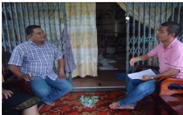
ภาพที่ 1.26 ภาพการสัมภาษณ์