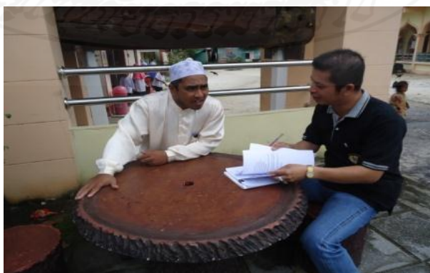
ภาพที่ 1.27 ภาพการสัมภาษณ์