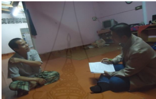
ภาพที่ 1.21 ภาพการสัมภาษณ์