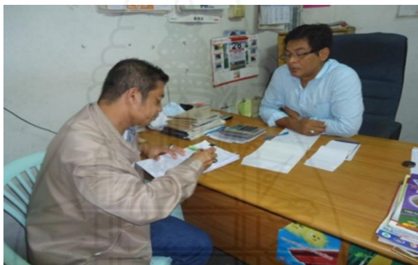
ภาพที่ 1.35 ภาพการสัมภาษณ์