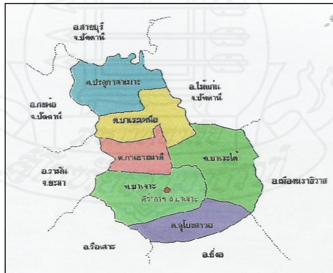
ภาพที่ 2.2 แผนที่อำเภอเขาชะเมา จังหวัดนครพนม

และมีเขตการปกครอง ออกเป็น 6 ตำบล 46 หมู่บ้าน ดังนี้