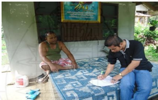
ภาพที่ 1.45 ภาพการสัมภาษณ์