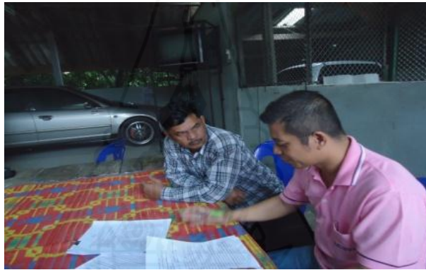
ภาพที่ 1.20 ภาพการสัมภาษณ์