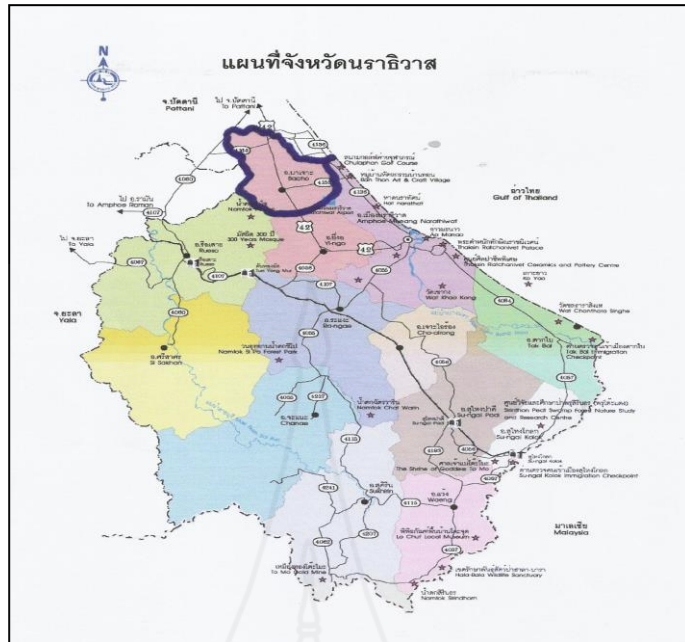
ภาพที่ 2.1 แผนที่จังหวัดนครพนม

และมีเขตการปกครอง ออกเป็น 6 ตำบล 46 หมู่บ้าน ดังนี้