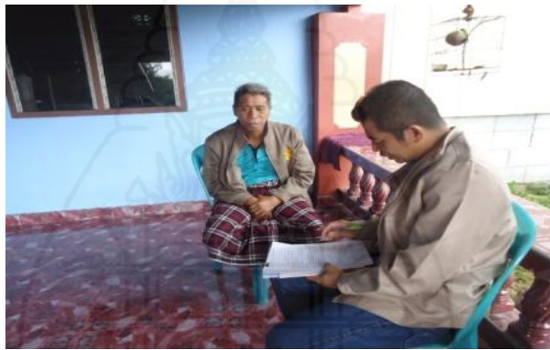
ภาพที่ 1.30 ภาพการสัมภาษณ์