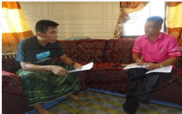
ภาพที่ 2.2 ภาพการสัมภาษณ์