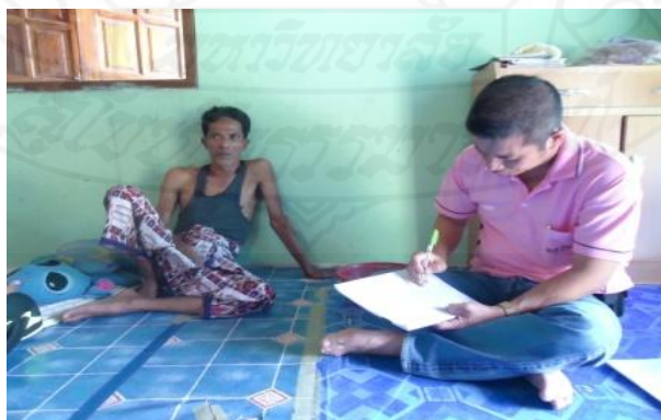
ภาพที่ 1.12 ภาพการสัมภาษณ์