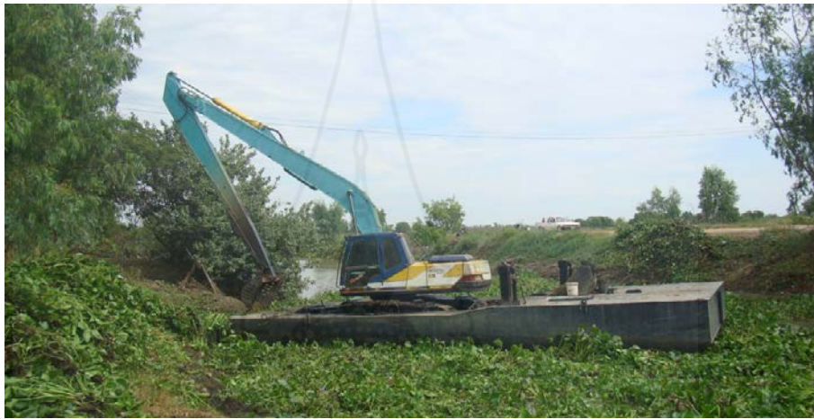
ภาพที่ 3.4 การกำจัดผักตบชวา

17.2 งบประมาณประจำปี พ.ศ. 2558 ได้ขอรับการสนับสนุนเครื่องจักรกลจากองค์การบริหารส่วนจังหวัดพระนครศรีอยุธยา ดำเนินการขุดลอกคลองภายในเขตพื้นที่ตำบลวังพัฒนา ซึ่งบรรจุไว้ในแผนพัฒนาสามปี พ.ศ. 2558-2560 ตามหนังสือการสนับสนุนเครื่องจักรกลที่ อย 51005/2923 ลงวันที่ 24 ธันวาคม 2558 เรื่อง การสนับสนุนเครื่องจักรกลองค์การบริหารส่วนจังหวัดพระนครศรีอยุธยา รวมระยะเวลาการปฏิบัติงาน 7 วัน