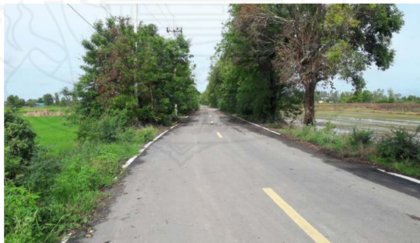
ภาพที่ 3.7 ถนนลาดยางแอสฟัลท์ติกคอนกรีต