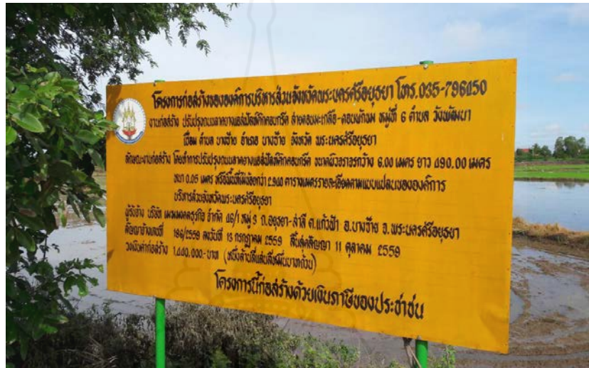
ภาพที่ 3.6 ป้ายโครงการปรับปรุงถนนลาดยางแอสฟัลท์ติกคอนกรีต

17.3 งบประมาณประจำปี พ.ศ. 2559 ได้รับการสนับสนุนเป็นการปรับปรุงถนนลาดยางแอสฟัลท์ติกคอนกรีต ซึ่งบรรจุอยู่ในแผนพัฒนาสามปี พ.ศ. 2559-2561 ขององค์การบริหารส่วนตำบลวังพัฒนา ถนนลาดยางแอสฟัลท์ติกคอนกรีต กว้าง 6.00 เมตร ยาว 490.00 เมตร งบประมาณดำเนินการ 1,440,000 บาท