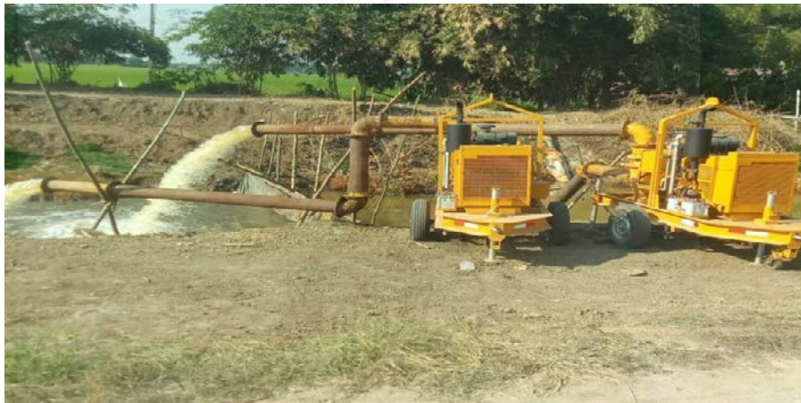
ภาพที่ 3.8 เครื่องสูบน้ำ

17.4 งบประมาณปี พ.ศ. 2560 ได้รับการสนับสนุนโครงสร้างพื้นฐานเกี่ยวกับวัสดุ อุปกรณ์เครื่องสูบน้ำ 2 เครื่อง เพื่อช่วยเหลือบรรเทาความเดือดร้อนของเกษตรกรที่ทำนาภายในเขตพื้นที่ตำบลวังพัฒนา ตามหนังสือขอรับการสนับสนุน ที่ อย 81801/52 ลงวันที่ 6 กุมภาพันธ์ 2560 เรื่อง ขอรับการสนับสนุนเครื่องสูบน้ำ รวมระยะเวลาดำเนินการ 15 วัน ตั้งแต่วันที่ 10 ถึง 24 กุมภาพันธ์ 2560 โดยองค์การบริหารส่วนตำบลวังพัฒนา จะสนับสนุนน้ำมันเชื้อเพลิงเครื่องสูบน้ำ จำนวน 50 ลิตร ต่อเครื่องต่อวัน