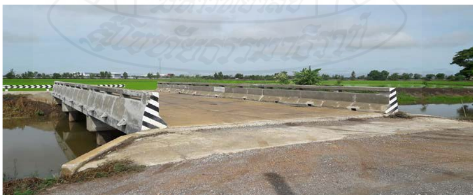
ภาพที่ 3.3 สะพานคอนกรีตเสริมเหล็ก (ด้านหน้า)