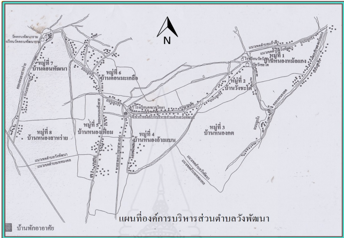
ภาพที่ 3.1 แผนที่องค์การบริหารส่วนตำบลวังพัฒนา