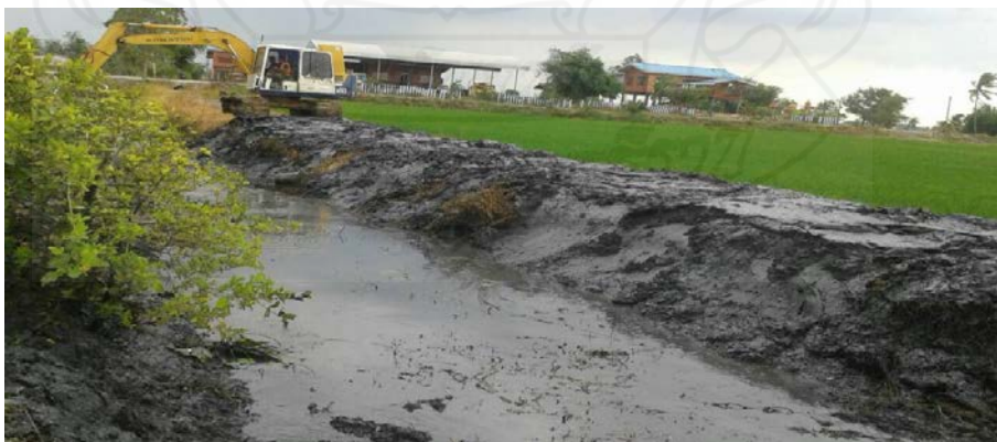
ภาพที่ 3.5 การขุดลอกคลอง