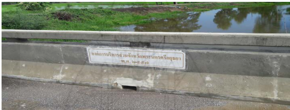
ภาพที่ 3.2 สะพานคอนกรีตเสริมเหล็ก (ด้านข้าง)

17.1 งบประมาณประจำปี พ.ศ. 2557 ได้รับการสนับสนุนเป็นสะพานคอนกรีตเสริมเหล็ก 1 ตัว จากแผนพัฒนาสามปี พ.ศ. 2557-2559 ขององค์การบริหารส่วนตำบลวังพัฒนา สะพานคอนกรีตเสริมเหล็กขนาด กว้าง 5.00 เมตร ยาว 15.00 เมตร งบประมาณ 950,000 บาท