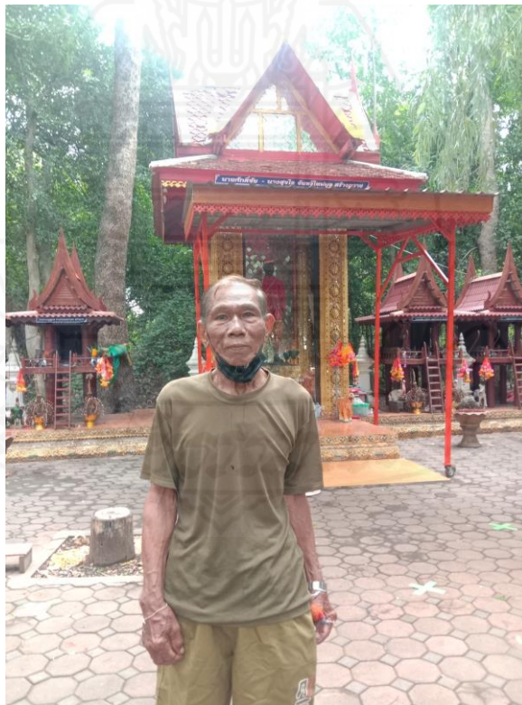
ภาพที่ 4.3 กวนในเทศบาลตำบลบ่อกรุด

ความเชื่อของคนในชุมชนบ่อกรุด้วย จากการสังเกตการสืบทอดตำแหน่งผู้นำนักบวชหรือกวนนั้น จะสืบทอดเฉพาะคนในตระกูลเดียวกันเท่านั้น ซึ่งทำให้ตำแหน่งนี้เป็นตำแหน่งผูกขาดอำนาจในเรื่องศาสนพิธี กวนจะทำหน้าที่ดูแลศาลและประกอบพิธี การเก็บน้ให้กับชาวบ้าน การจัดงานประจำปีหรืองานทำบุญหอยซึ่งจะมีคนทรงประกอบพิธีดังกล่าวนี้ แต่สำหรับบ้านบ่อกรุดคนทรงและกวนคือคน ๆ เดียวกัน แต่ในปัจจุบันไม่มีการเข้าทรงแล้ว ซึ่งชาวลาวครั้งในชุมชนบ่อกรุด อำเภอเดิมบางนางบวช จังหวัดสุพรรณบุรี และในหมู่บ้านอื่น ๆ ของชาวลาวครั้งก็จะนับถือเจ้าพ่อด้วยเช่นกัน รวมทั้งกวนซึ่งมีประจำในแต่ละหมู่บ้าน แต่อย่างไรก็ดี กวนในหมู่บ้านหนึ่งจะเข้ามาประกอบศาสนกิจในอีกหมู่บ้านหนึ่งได้เช่นกัน นอกจากนี้กวนซึ่งเป็นนักบวชหลักในการประกอบศาสนกิจของชาวลาวครั้งแล้วยังมีการคัดเลือกตำแหน่งทหารเจ้าพ่อ ซึ่งทหารดังกล่าวมีหน้าที่ในการช่วยเหลือกวน โดยตรงแต่ทว่าไม่สามารถติดต่อกับเจ้าพ่อเหมือนเช่นกวนได้ เมื่อชาวบ้านในชุมชนพบเจอปัญหาหรืออุปสรรคใดก็ตาม ชาวบ้านมักจะบนบานด้วยเหล้าหนึ่งขวดและไก่อีกหนึ่งตัวแต่หากมีฐานะมากกว่านั้นอาจใช้เครื่องเซ่นที่มากกว่านี้ก็ได้ โดยกวนจะทำหน้าที่สื่อสารกับเจ้าพ่อคงไม่งามโดยตรง” (สัมภาษณ์, 17 มิถุนายน 2564)