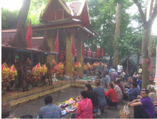
ภาพที่ 4.1 การจัดงานเลี้ยงปีเจ้าพ่อดงไม้งาม

เทศบาลตำบลบ่อกรู มีศาลพ่อเต่าแสนหาญอยู่หนึ่งหลังแต่คนในชุมชนบ่อกรูตั้งชื่อศาลว่า “ศาลเจ้าพ่อดงไม้งาม” การสร้างศาลเจ้าพ่อดงไม้งามก็เพื่อเป็นอนุสรณ์เพื่อรำลึกถึงพ่อแสนหาญของพวกเขา