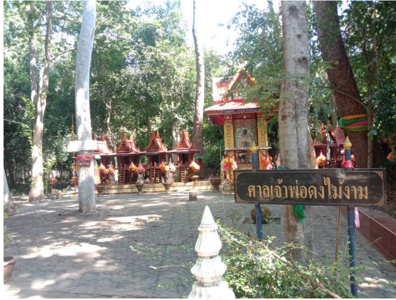
ภาพที่ 4.4 บริเวณศาลเจ้าพ่อดงไม้งาม

ชาวบ้านจะไปทำบุญที่วัดบ่อกรุเป็นส่วนมาก โดยเฉพาะชาวลาวครั้งในเทศบาลตำบลบ่อกรุ ทำให้วัดบ่อกรุกลายเป็นจุดศูนย์รวมของชาวลาวครั้งมานับตั้งแต่อดีต นอกจากทำบุญแบบพุทธศาสนาที่ได้กล่าวมาแล้วนั้น ชาวลาวครั้งในตำบลบ่อกรวยังนับถือผีบรรพบุรุษทั้งผีเทวดาและผีเจ้านายซึ่งเป็นสิ่งศักดิ์สิทธิ์ที่สืบทอดมายาวนานตั้งแต่สมัยอยู่ที่เวียงจันทร์ของประเทศลาว ชาวบ้านในตำบลบ่อกรวยังให้ความสำคัญในการเซ่นไหว้ผีบรรพบุรุษอย่างเหนียวแน่น โดยมีการสร้างศาลผีบรรพบุรุษไว้ที่มีป่าไม้ปกคลุม ซึ่งจะมีการไหว้เซ่นบวงสรวงผีบรรพบุรุษเป็นประจำทุก ๆ ปี ซึ่งถือว่าเป็นงานวันสำคัญวันหนึ่งที่ชาวบ้านในเทศบาลตำบลบ่อกรุ อำเภอเดิมบางนางบวชจังหวัดสุพรรณบุรี จะได้ทำกิจกรรมร่วมกัน