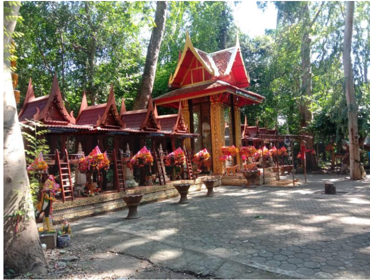
ภาพที่ 4.2 การปลูกสร้างศาลเจ้าพ่อดงไม้งาม

นางจรรินทร์ สีวันนา กล่าวว่า “ศาลเจ้าพ่อเป็นสิ่งปลูกสร้างที่ใหญ่และสูงกว่าศาลลูกบริเวณหลังคาจะมุงกระเบื้องและมีฐานเสาจำนวน 6 ต้น แต่ถ้าเป็นหอลูกจะเป็นศาลหลังเล็ก เป็นศาลไม้สักทรงไทย ทำฐานด้วยปูนคอนกรีตติดลายกนก ลายไทย มีเพียงสามสำหรับใส่ข้าวสุกและไถ่ต้มที่นำมาเช่นสังเวชบูชาเท่านั้น เมื่อชาวบ้านนำไถ่ต้มมาแก้บน ทหารเจ้าพ่อจะฉีกไถ่เป็นชิ้น ๆ จากนั้นกวานจะนำชิ้นไถ่ใส่เอาไว้ในสามซึ่งตั้งอยู่บนหอเจ้าพ่อ และหอลูกตามลำดับ พิธีดังกล่าวนี้เรียกว่า “การแจกจ่ายไถ่” และเมื่อเสร็จสิ้นพิธีลง กวานจะแจกจ่ายไถ่ที่ใช้ในการประกอบพิธีกรรมให้กับชาวบ้านที่เข้าร่วมประกอบพิธี นอกจากนี้เหล่าที่นำมาใช้ในการประกอบพิธีนั้นกวานจะนำใบมะยมจุ่มในเหล้า พร้อมทั้งพรมลงไปในพื้นดิน ซึ่งชาวลาวครั้งเชื่อว่าเจ้าพ่อจะช่วยคุ้มครองคนในชุมชนบ่อกรุให้อยู่เย็นเป็นสุข” (สัมภาษณ์, 17 กรกฎาคม 2564)