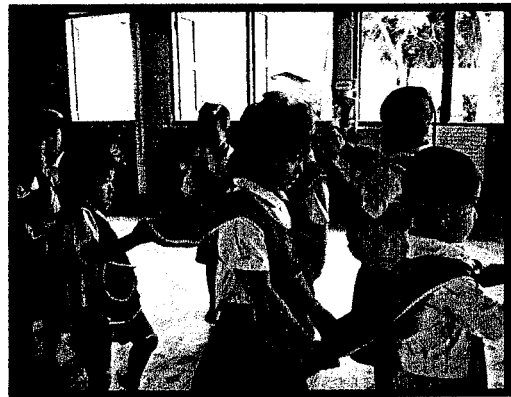
เคลื่อนไหวร่างกายพร้อมอุปกรณ์