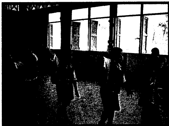
แสดงท่าทางเลียนแบบยานพาหนะ