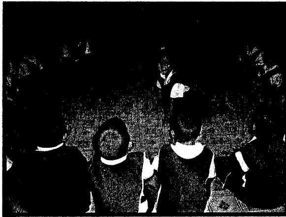
แสดงท่าทางเลียนแบบสัตว์ให้เพื่อนท่าย