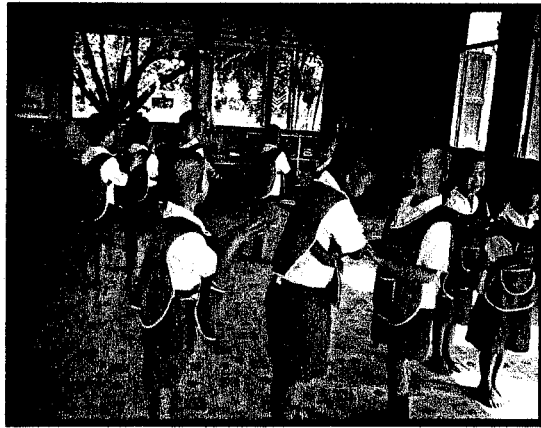
แสดงท่าทางเป็นตุ๊กตาล้มลุก