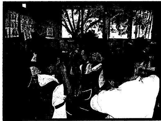
แสดงเป็นกระจกเลียนแบบท่าทางของเพื่อน