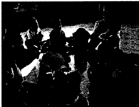
แสดงท่าทางความรู้สึกตอบสนองต่อภาพที่เห็น