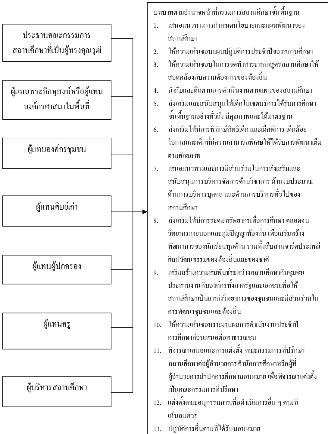
ภาพที่ 1.1 กรอบแนวคิดในการวิจัย