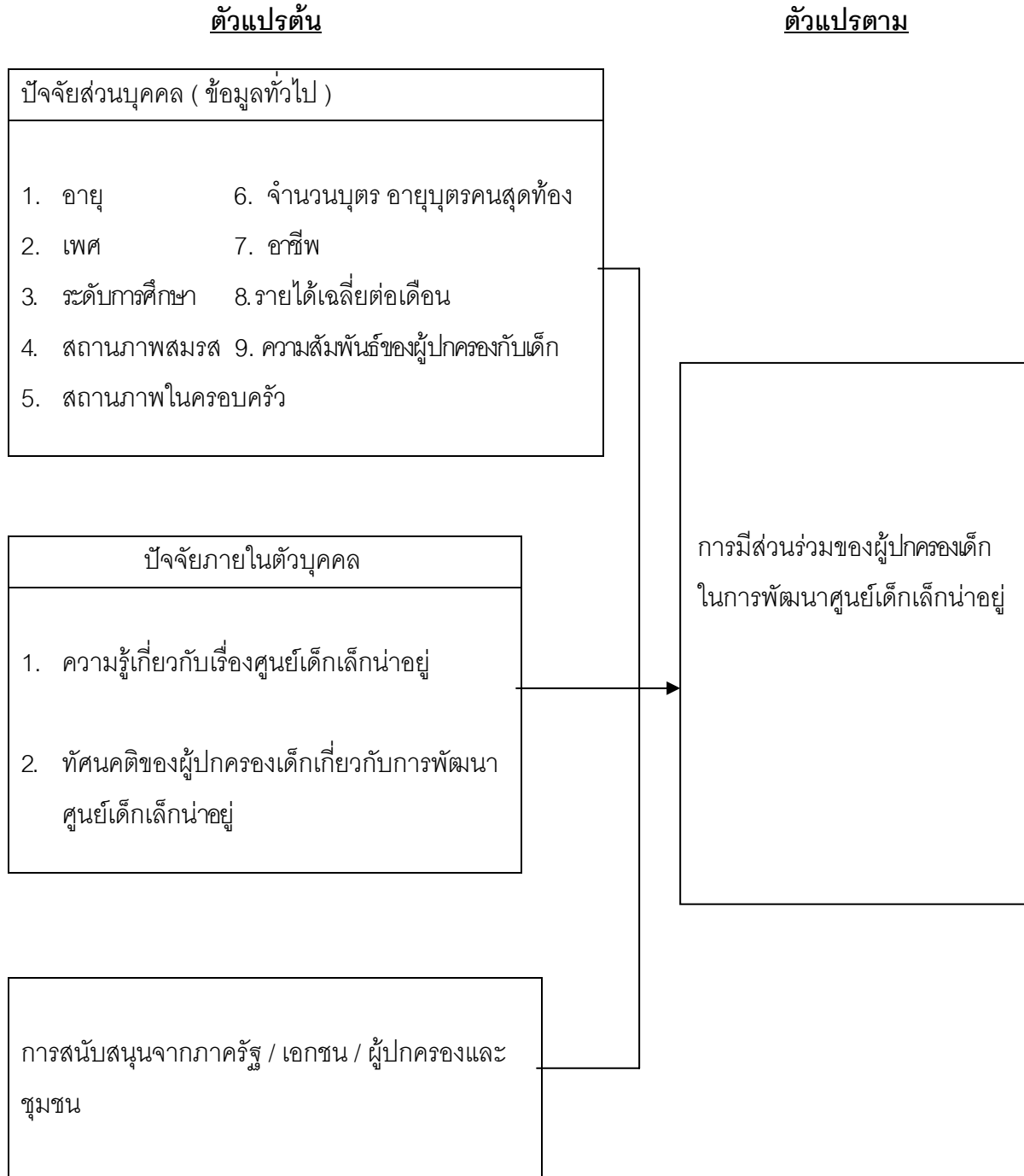
ภาพที่ 1.1 กรอบแนวคิดการวิจัย