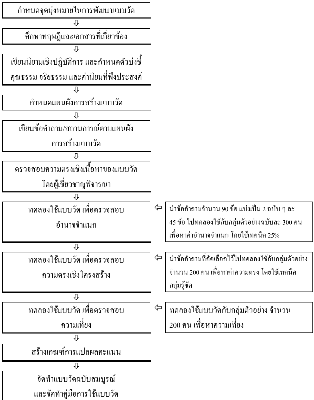
ภาพที่ 3.1 ขั้นตอนการพัฒนาแบบวัดคุณธรรม จริยธรรม และค่านิยมที่พึงประสงค์