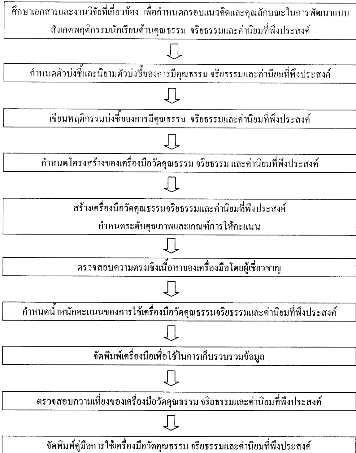
ภาพที่ 3.1 ขั้นตอนการพัฒนาเครื่องมือวัดคุณธรรม จริยธรรมและค่านิยม ที่พึงประสงค์ของนักเรียน