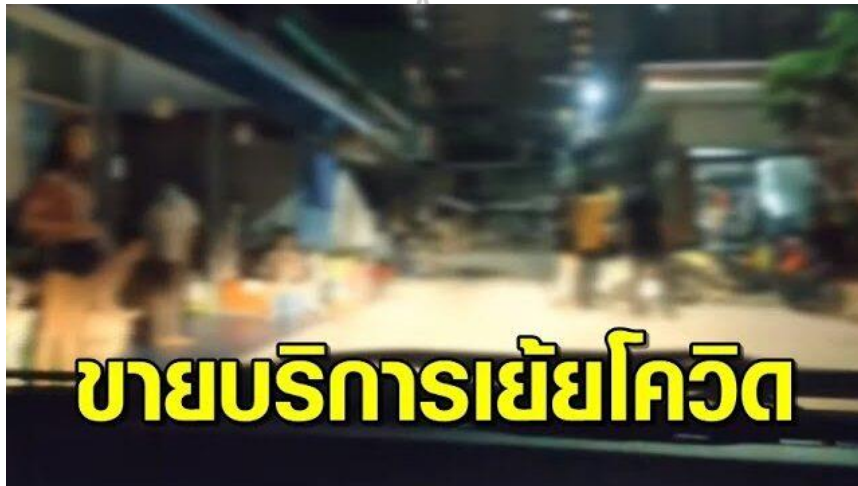
ภาพที่ 4.3 ตัวอย่างการพาดหัวข่าวการนำเสนอข่าวของสื่อมวลชน ที่มา: จาก https://theactive.net/news/politics-20231018/(2565)

ว่าด้วยจริยธรรมแห่งวิชาชีพสื่อมวลชน และไม่อยู่บนพื้นฐานหลักการสิทธิมนุษยชน ส่งผลให้เกิดการตีตราและเลือกปฏิบัติ อันเนื่องมาจากความแตกต่างหลากหลายของกลุ่มคน ตัวอย่างการนำเสนอข่าวที่เกี่ยวข้องกับพนักงานบริการทางเพศที่ผ่านมา เช่น สาวแต่งหวีไม่ใส่แมสก์ ยืนดักขายบริการให้หนุ่ม อารมณ์เปลี่ยว เขี่ยคำสั่ง ศบค. ไม่หวั่นโควิด 18