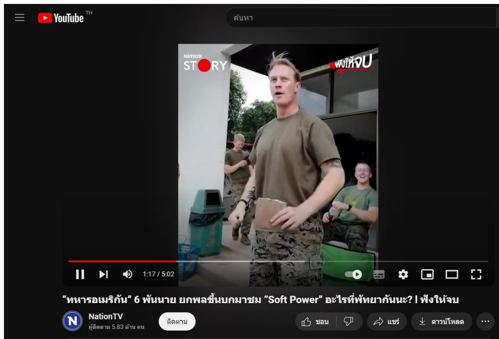
ภาพที่ 4.1 ตัวอย่างชาวทหารอเมริกันยกพลขึ้นบกที่เมืองพัทยา