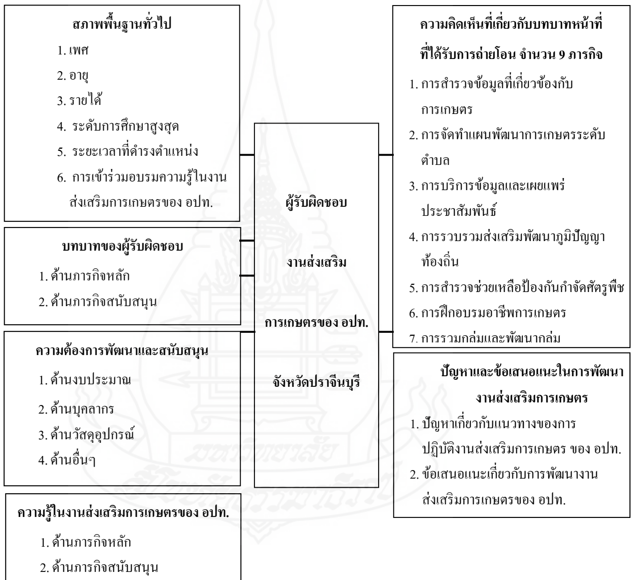
ภาพที่ 1.1 กรอบแนวคิดวิจัย

การศึกษาครั้งนี้มีกรอบแนวคิดเกี่ยวกับสภาพพื้นฐาน ความรู้ ความคิดเห็น บทบาท ความต้องการพัฒนาของผู้รับผิดชอบงานส่งเสริมการเกษตร รวมถึงปัญหาและข้อเสนอแนะเพื่อพัฒนางานส่งเสริมการเกษตรขององค์กรปกครองส่วนท้องถิ่น ดังภาพที่ 1.1