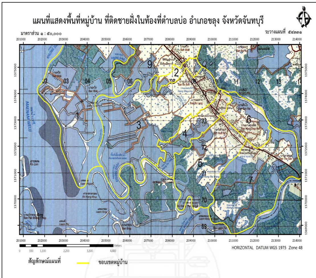
ภาพที่ 2.2 แผนที่แสดงหมู่บ้านที่ติดทะเล ท้องที่ตำบลบ่อ อำเภอลดง จังหวัดจันทบุรี ที่มา : http://www.tambonbor.go.th/index.php ค้นคืนวันที่ 25 เมษายน 2557