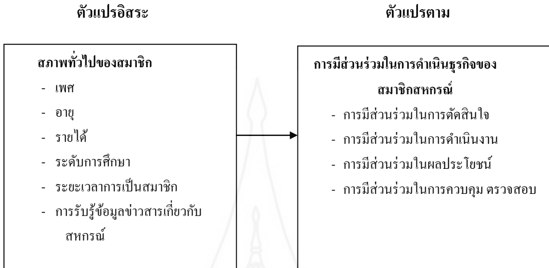
ภาพที่ 1.1 กรอบแนวคิดในการวิจัย