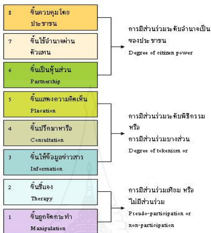
ภาพที่ 2.1 บันไดของการมีส่วนร่วม 8 ขั้น ของอาร์นสไตน์