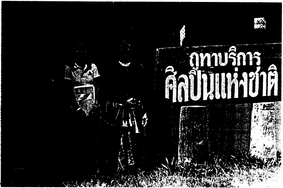
ภาพนายทองมาก จันทะลือ ร่วมถ่ายภาพกับผู้วิจัย