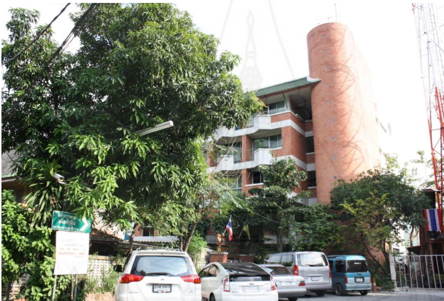
ภาพที่ 4.3 บริเวณหน้าอาคารที่ทำการพรรคเพื่อฟ้าดิน