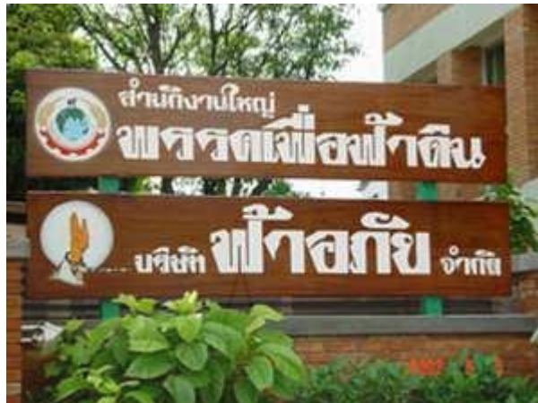
ภาพที่ 4.1 ป้ายที่ตั้งสำนักงานใหญ่พรรคเพื่อฟ้าดิน

การก่อเกิดพรรคเพื่อฟ้าดินนั้นได้รับการสนับสนุนอย่างเต็มที่ จาก ชาวสันตือโศก ญาติธรรมและผู้ที่เกี่ยวข้องปฏิบัติธรรมร่วมกัน สันตือโศกเป็นชุมชนที่ดำเนินมากกว่า ๓๐ ปี เป็นผู้คนที่นับถือวิถีพุทธแบบสันตือโศกและค่อยๆเพิ่มจำนวนขึ้นเรื่อยๆ และนอกจากจะเป็นกลุ่มคนส่วนหนึ่งที่เข้าไปมีส่วนร่วมเคลื่อนไหวทางการเมืองเป็นครั้งคราว แต่ยังมีชาวโศกอีกจำนวนมาก ที่ปฏิบัติตนบำเพ็ญเพียรทางด้านศาสนา และอีกส่วนหนึ่งดำเนินกิจกรรมตามแนวทางเศรษฐกิจแบบพอเพียง และพึ่งพาตนเอง โดยอาศัยระบบบุญนิยม ที่เน้นเป็นผู้ให้มากกว่าการแสวงหากำไร ซึ่งกลุ่มคนเหล่านี้แต่ละคนจะทำตามศรัทธาและความเชื่อได้อย่างสมัครใจ ยึดถือมังสวิรัต เลือกวถีทางเกษตรอินทรีย์ตามวิถีทางธรรมชาติ และเป็นชุมชนที่เป็นปึกแผ่นเข้มแข็ง และให้การสนับสนุนการจัดตั้งพรรคเพื่อฟ้าดิน