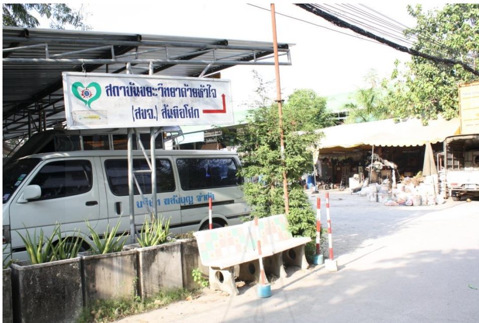
ภาพที่ 4.6 สภาพแวดล้อมทั่วไปบริเวณที่ทำการพรรคเพื่อฟ้าดิน

สภาพแวดล้อมทั่วไปในบริเวณที่ตั้งของพรรคเพื่อฟ้าดิน สำนักงานใหญ่ ในย่านถนนนวมินทร์ แขวงคลองกุ่ม เขตบึงกุ่ม กรุงเทพมหานคร ตั้งอยู่ในบริเวณเดียวกับลานปฏิบัติธรรมของสำนักสันติอโศก พื้นที่บริเวณใกล้เคียงเป็นอาคารบ้านเรือน อาคารพาณิชย์ จำนวนมากซึ่งได้ปรับปรุงเป็นห้างร้านขายของในชุมชน อาคารห้องสมุด สำนักพิมพ์ ที่สำคัญ เช่น บริษัทฟ้าอภัย จำกัด บริษัทพลังบุญสถาบันบุญนิยม สถาบันพระยาด้วยหัวใจ มูลนิธิธรรมสันติ เป็นต้น นอกจากนี้จะมีชาวอโศกและคนทั่วไปมาปฏิบัติธรรมแล้ว ในบริเวณชุมชนยังมีการจำหน่ายสินค้าทั่วไปในราคาถูกตามร้านค้าต่างๆ สินค้าส่วนใหญ่เป็นผลผลิตที่เกิดจาก ศูนย์เกษตรกรรมอุตสาหกรรมที่ผลิตในชุมชน ที่ศรีระอโศกซึ่งมีผลิตภัณฑ์มากมาย ที่โดดเด่น เช่น แชมพู ยาสมุนไพร ปุ๋ย เป็นต้น เป็นรายได้ของชุมชนและเป็นการให้โอกาสคนทั่วไปได้ซื้อของในราคาที่ถูกร้านค้าในย่านนั้นจะมีชื่อที่สอดคล้องกับชื่อของชุมชนสันติอโศก