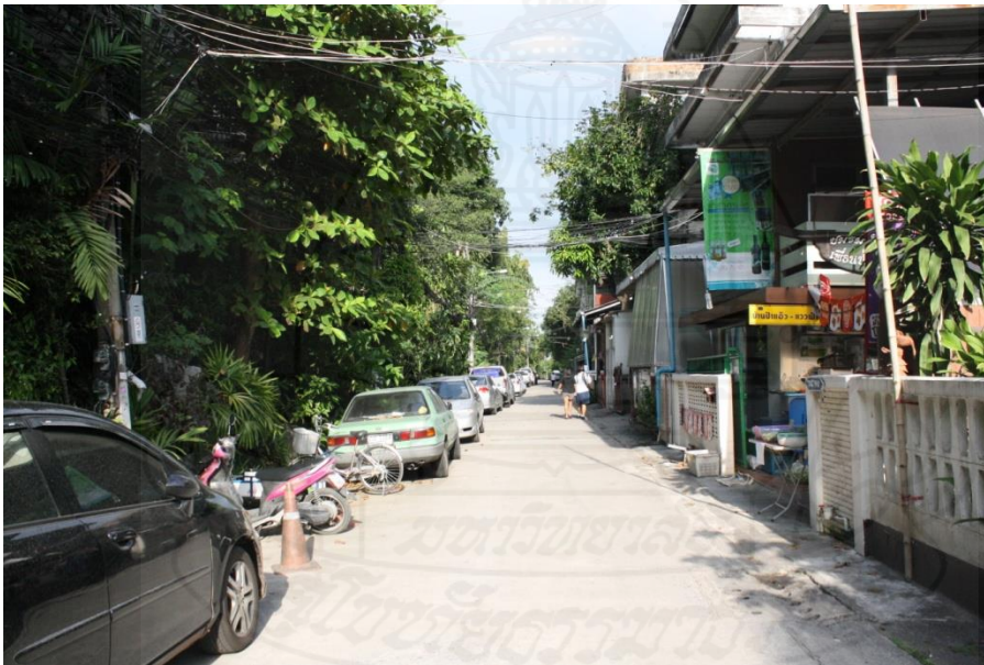
ภาพที่ 4.5 สภาพแวดล้อมทั่วไปบริเวณที่ทำการพรรคเพื่อฟ้าดิน