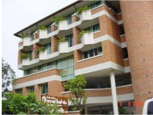
ภาพที่ 4.2 อาคารตึกใหม่ 65/5ซอยเทียมพร ถนนนวมินทร์ แขวงคลองกุ่ม เขตบึงกุ่ม กรุงเทพฯ