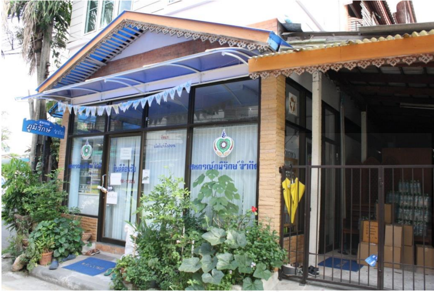
ภาพที่ 4.4 สภาพแวดล้อมทั่วไปบริเวณที่ทำการพรรคเพื่อฟ้าดิน