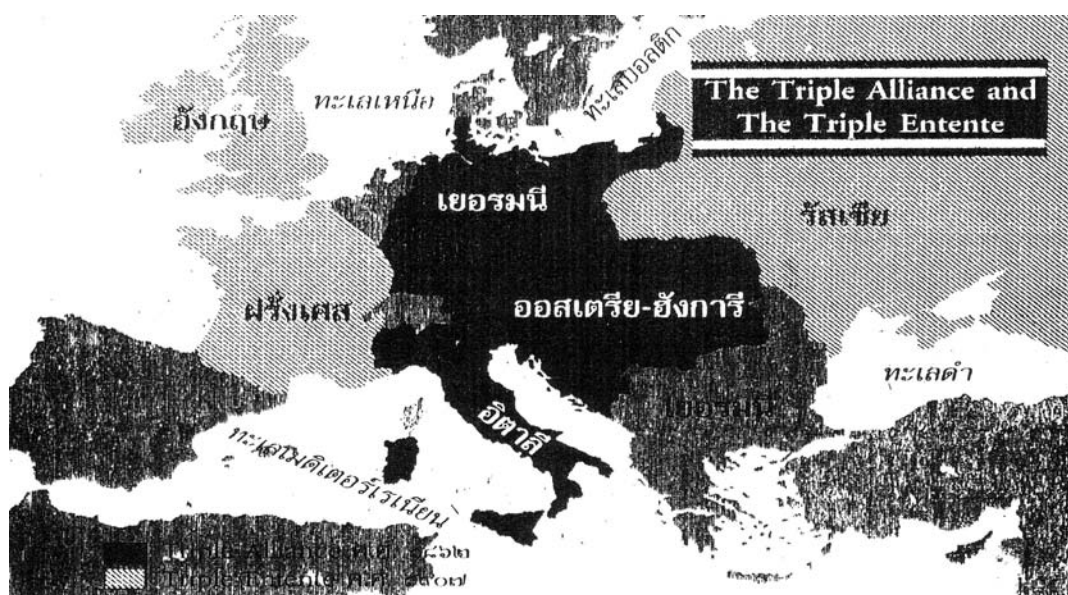
แผนที่แสดงการแบ่งค่ายประเทศมหาอำนาจตะวันตกก่อนเกิดสงครามโลกครั้งที่ 1

เนื่องจากประเทศไทยมีความสัมพันธ์กับชาติต่าง ๆ มายาวนานทำให้ช่วงเริ่มต้นสงครามสถานการณ์ยังไม่ชัดเจนว่าผลจะออกมาเป็นเช่นใด ไทยจึงประกาศวางตัวเป็นกลาง ดำเนินความสัมพันธ์อย่างอิสระ ไม่เข้าข้างฝ่ายใดฝ่ายหนึ่ง แต่เมื่อสงครามโลกครั้งที่ 1 ดำเนินมาได้ประมาณ 3 ปี ไทยก็ประกาศเข้าข้างฝ่ายสัมพันธมิตร ทั้งนี้โดยมีเป้าหมายหลักว่า หากไทยอยู่ฝ่ายที่ชนะ จะได้อิทธิพลโอกาสหาหนทางแก้ไขสนธิสัญญาทางไมตรีและการพาณิชย์ตามรูปแบบสนธิสัญญาเบาว์ริงที่ไทยจำต้องยินยอมกระทำกับชาติตะวันตกนับตั้งแต่สมัยรัชกาลที่ 4