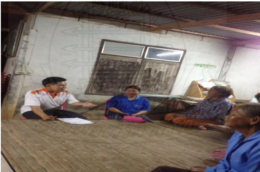
รูปภาพ การสำรวจข้อมูล การยอมรับของชุมชนท้องถิ่นในกิจกรรมการขยายแนวเขตป่าอนุรักษ์ บริเวณเขตรักษาพันธุ์สัตว์ป่าตะเบาะ-ห้วยใหญ่ ในท้องที่ตำบลถ้ำวัวแดง อำเภอนองบัวแดง จังหวัดชัยภูมิ