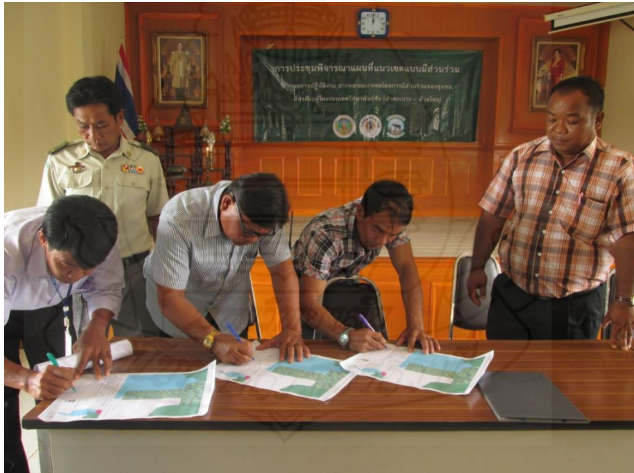
รูปภาพขั้นตอนที่ 4 การประชุมพิจารณาแผนที่แนวเขตแบบมีส่วนร่วมในระดับตำบล