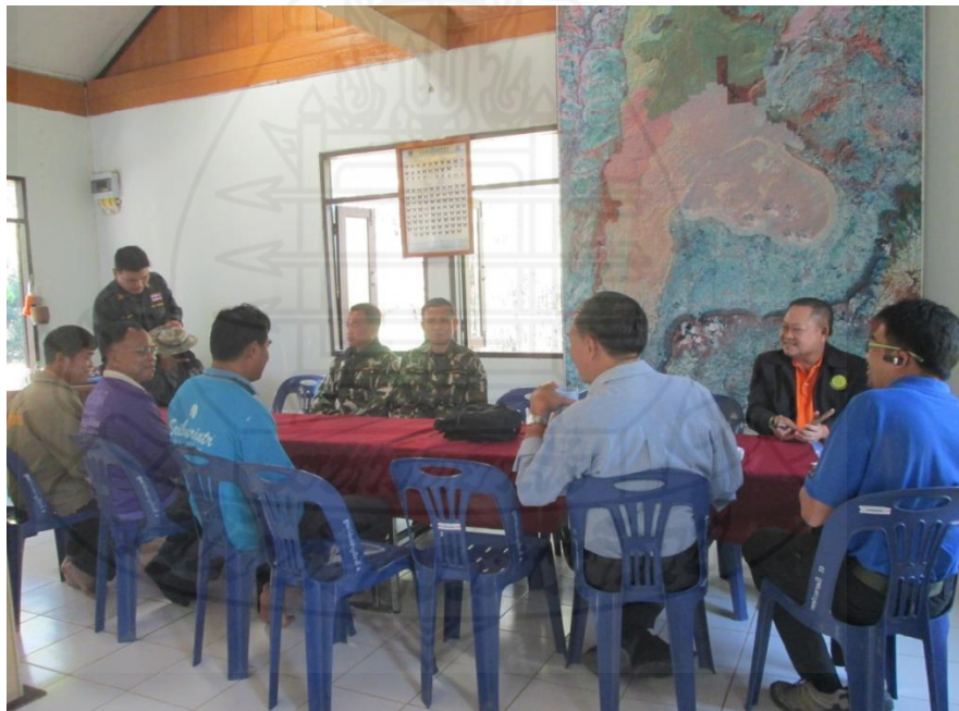
รูปภาพขั้นตอนที่ 2 การจัดประชุมชี้แจงหน่วยงานที่เกี่ยวข้อง