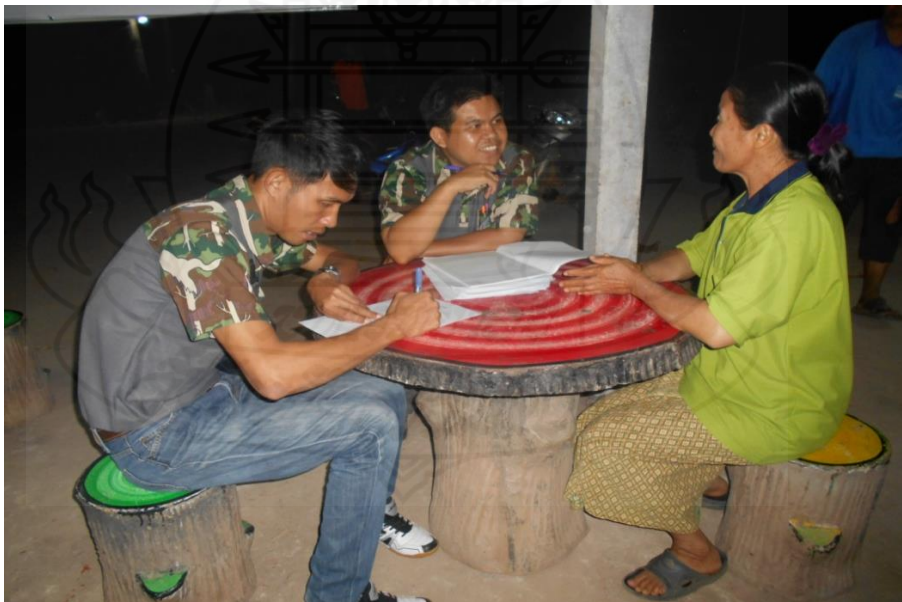
รูปภาพ การสำรวจข้อมูล การยอมรับของชุมชนท้องถิ่นในกิจกรรมการขยายแนวเขตป่าอนุรักษ์ บริเวณเขตรักษาพันธุ์สัตว์ป่าตะเบาะ-ห้วยใหญ่ ในท้องที่ตำบลนางแดด อำเภอหนองบัวแดง จังหวัดชัยภูมิ