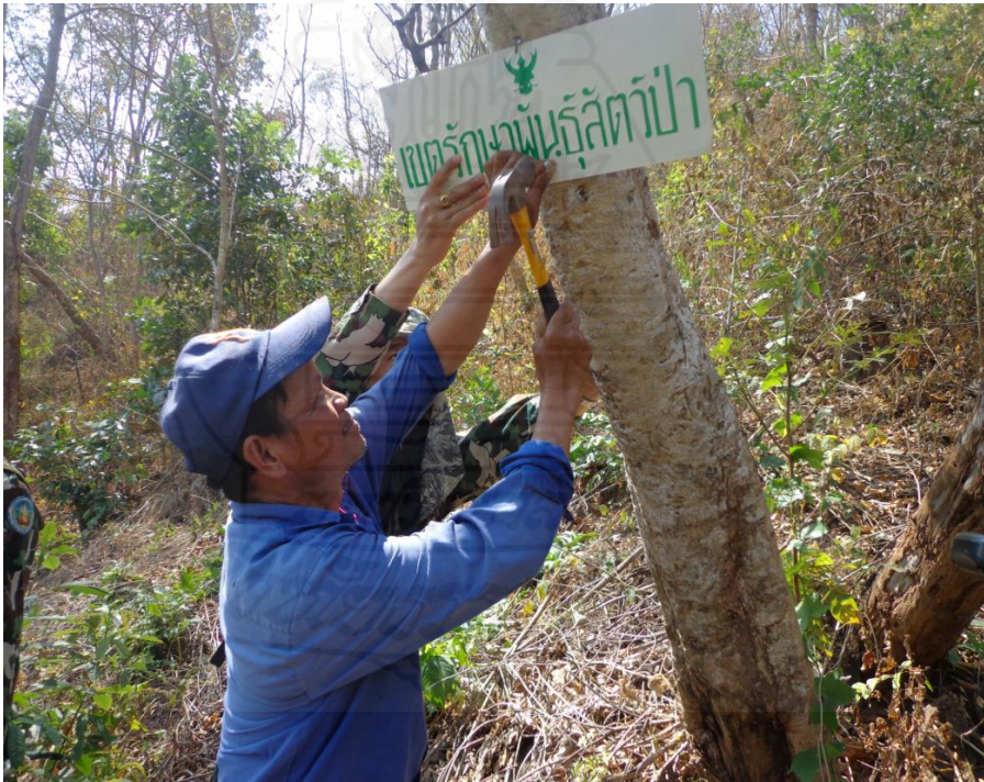
รูปภาพขั้นตอนที่ 3 การจัดประชุมชี้แจงหมู่บ้านเป้าหมายและร่วมเดินหมายแนวเขตป่าอนุรักษ์ และทำบันทึกข้อตกลง