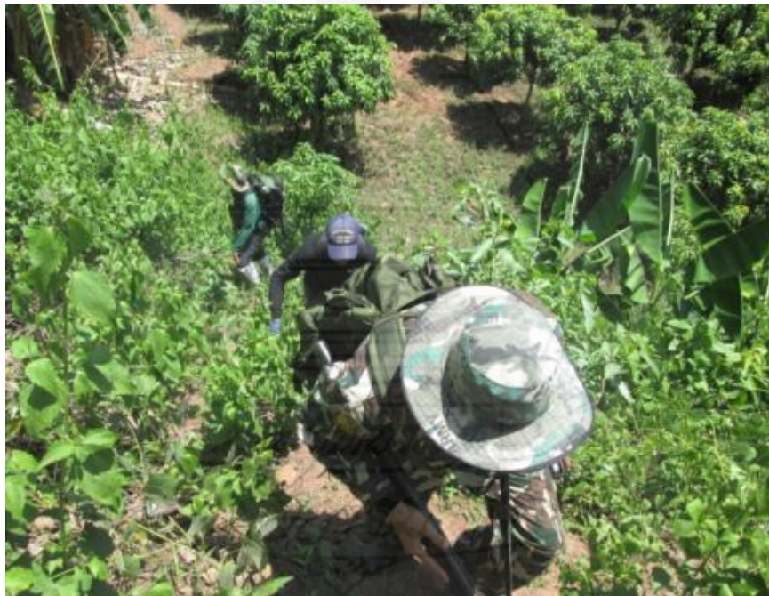
รูปภาพขั้นตอนที่ 1 การตรวจสอบแนวเขตเบื้องต้นโดยเจ้าหน้าที่