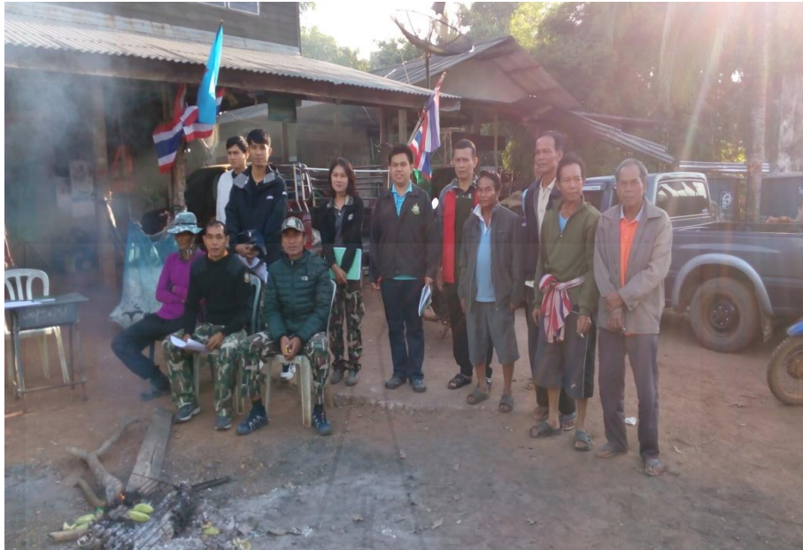
รูปภาพ ทีมสำรวจข้อมูล การยอมรับของชุมชนท้องถิ่นในกิจกรรมการขยายแนวเขตป่าอนุรักษ์ บริเวณเขตรักษาพันธุ์สัตว์ป่าตะเบาะ-ห้วยใหญ่ อำเภอนองบัวแดง จังหวัดชัยภูมิ