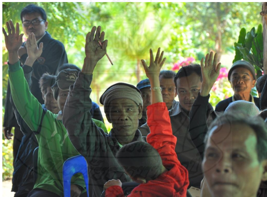
รูปภาพขั้นตอนที่ 3 การจัดประชุมชี้แจงหมู่บ้านเป้าหมายและร่วมเดินหมยแนวเขตป่าอนุรักษ์ และทำบันทึกข้อตกลง