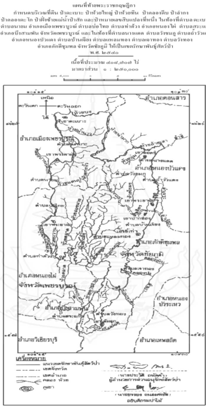
ภาพที่ 2.1 แผนที่ท้ายพระราชกฤษฎีกาเขตรักษาพันธุ์สัตว์ป่าตะเบาะ – ห้วยใหญ่

และสำหรับพื้นที่เสี่ยงต่อการพังทลายของดิน ได้แก่ บริเวณสองข้างทางขึ้นที่ทำการของเขตรักษาพันธุ์สัตว์ป่าตะเบาะ-ห้วยใหญ่ เนื่องจากมีสภาพเป็นภูเขาสูงชันและเมื่อถึงฤดูฝนน้ำจะไหลบ่าและกัดเซาะทำให้บริเวณสองข้างทางได้รับความเสียหายอยู่เป็นประจำ และได้รับการปรับปรุงแก้ไขโดยการทำขั้นบันไดและปลูกหญ้าแฝกเพื่อป้องกันการพังทลายของดิน