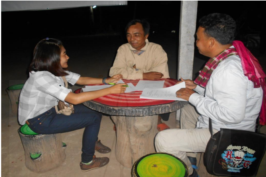
รูปภาพ การสำรวจข้อมูล การยอมรับของชุมชนท้องถิ่นในกิจกรรมการขยายแนวเขตป่าอนุรักษ์ บริเวณเขตรักษาพันธุ์สัตว์ป่าตะเบาะ-ห้วยใหญ่ ในท้องที่ตำบลนางแดด อำเภอหนองบัวแดง จังหวัดชัยภูมิ