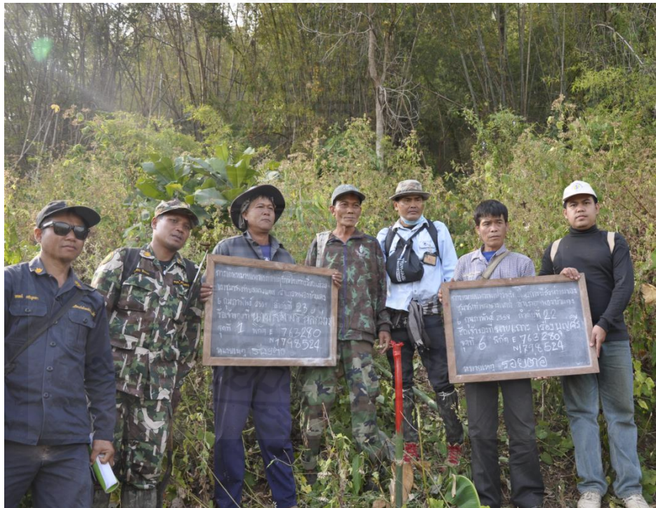
รูปภาพขั้นตอนที่ 3 การจัดประชุมชี้แจงหมู่บ้านเป้าหมายและร่วมเดินหมายแนวเขตป่าอนุรักษ์ และทำบันทึกข้อตกลง