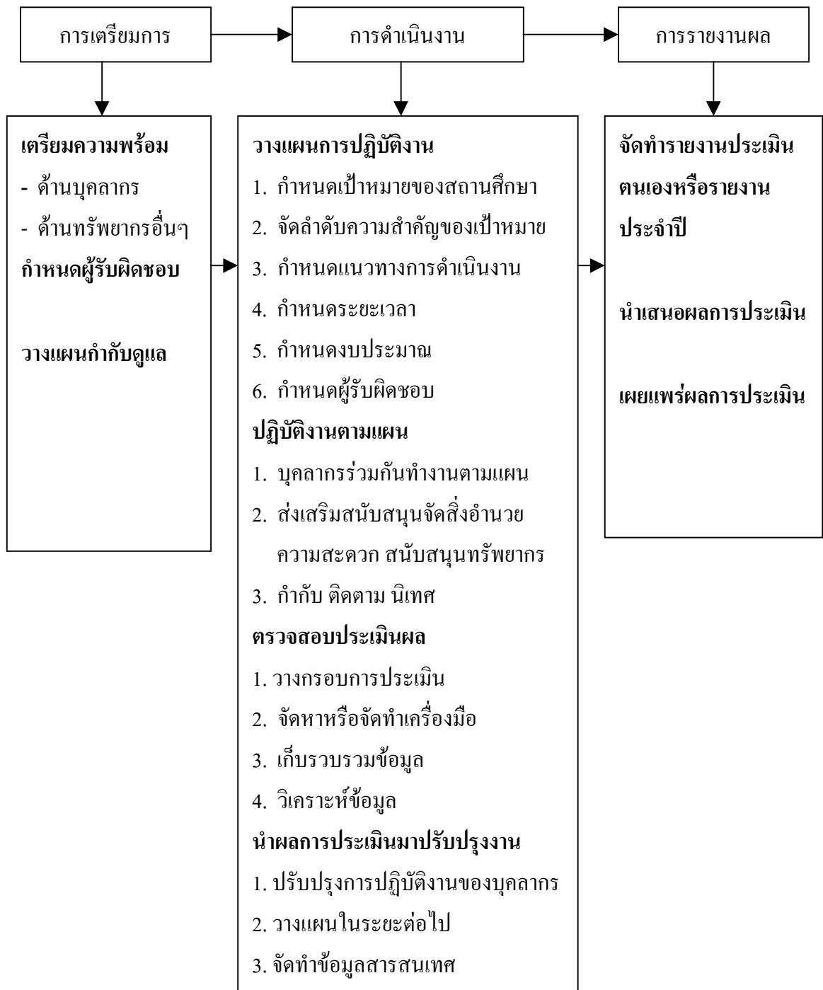
ภาพที่ 2.1 แผนภาพแสดงการดำเนินงานประกันคุณภาพภายในสถานศึกษา