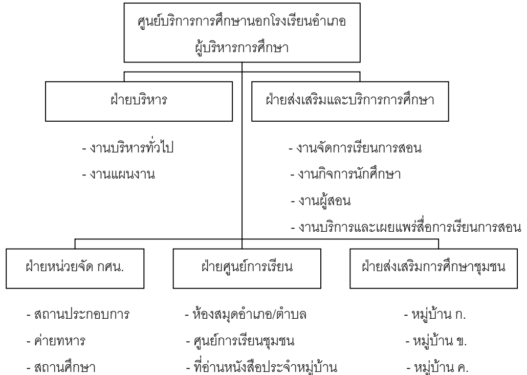
ภาพที่ 2.2 โครงสร้างการบริหารงานศูนย์บริการการศึกษานอกโรงเรียนอำเภอ